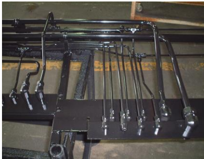
OST-2配管使用例(油圧機器)