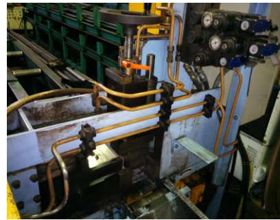
OST-2配管使用例(鋼管切断機)